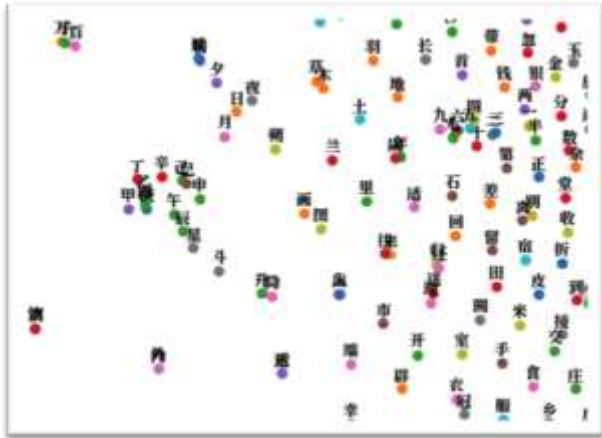
图 1. 古汉语神经词向量示例

在古汉语特征表示领域，Li 等（2018）基于《四库全书》训练了古汉语字义表示，图 1 示出了其向量空间经 PCA 降维后一个局部区域的汉字分布情况。由图可见，该区域语义表示与数字、时间等概念密切相关，形成了较为明显的数字词簇和时间词簇，如单位“千、百、万”，数词“一”到“九”，序数词“甲乙丙丁戊己庚辛”，时间词“日夜月夕”、“年岁”等。